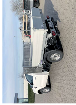
Werkzeugschrank zw. Fahrerhaus und Kipper