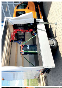
Pritsche mit speziellem Ladekran