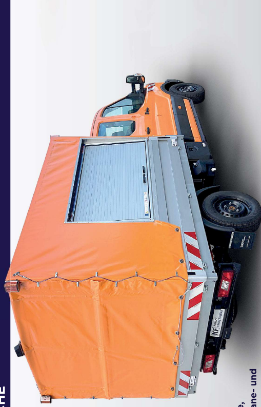
Ford Transit mit Pritsche, Werkzeugkasten und Plane- und Spriegelaufbau