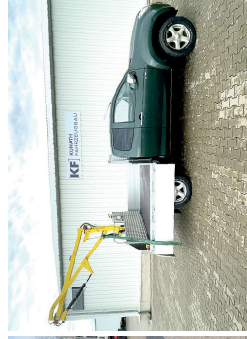
Pritsche mit speziellem Imker-Ladekran