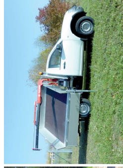
Kipper mit Kiste und Kran