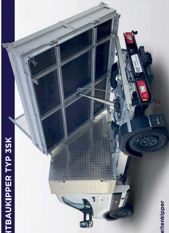
Ford Transit mit Dreiseitenkipper und Werkzeugkiste