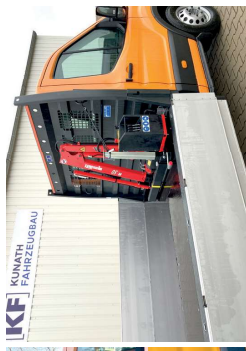
Ford Transit mit Kran