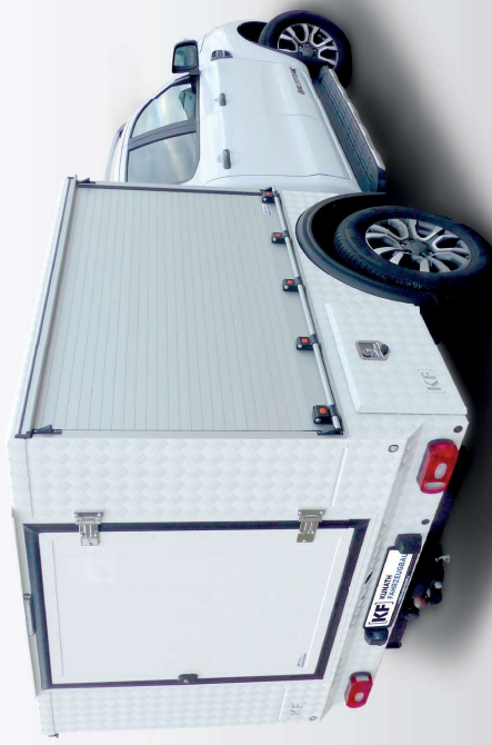
Ford Ranger mit Systemkofferaufbau