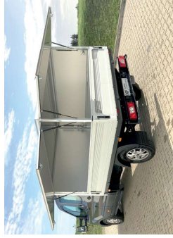
Kofferaufsatz mit Klappen