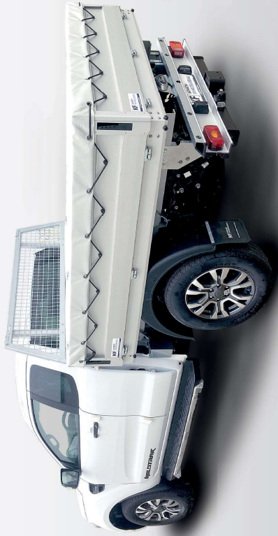
Ford Ranger mit Pritsche