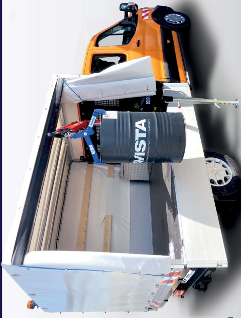
Ford Transit mit Pritsche, Plane- und Spriegelaufbau und Ladekran