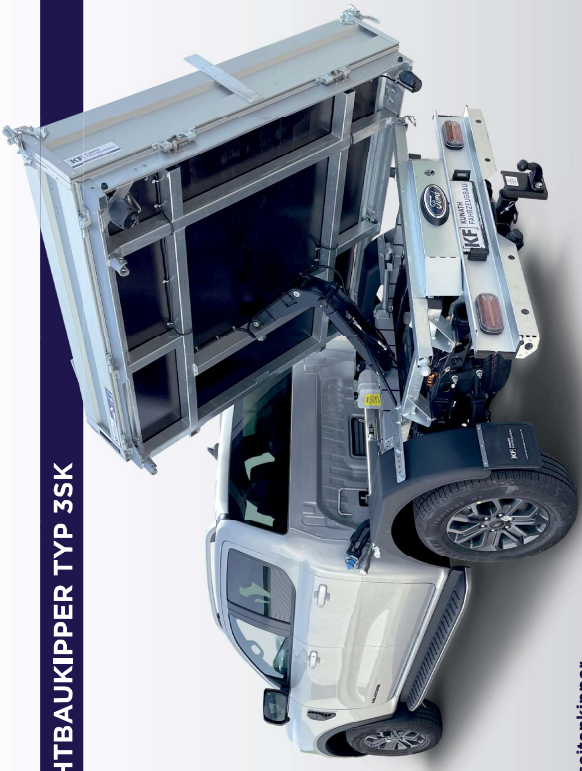
Ford Ranger mit Dreiseitenkipper