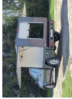
Kofferaufbau mit Klappen