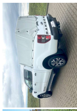
Plane- und Spriegel für Laderaumwanne