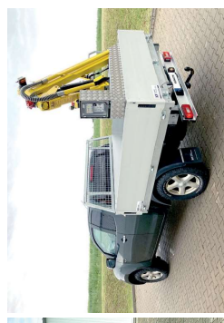
Pritsche mit speziellem Imker-Ladekran