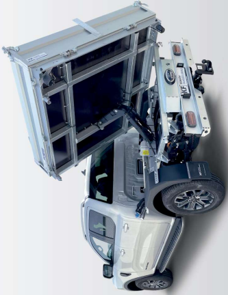
Fahrzeug nach Umbau