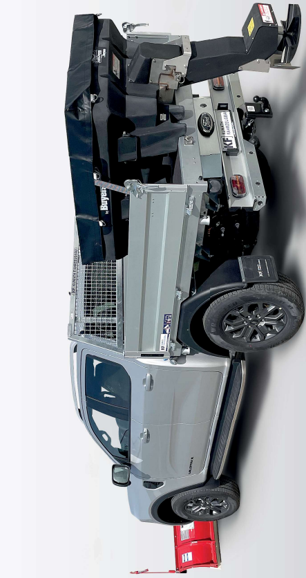
Ford Ranger mit Winterdiensttechnik