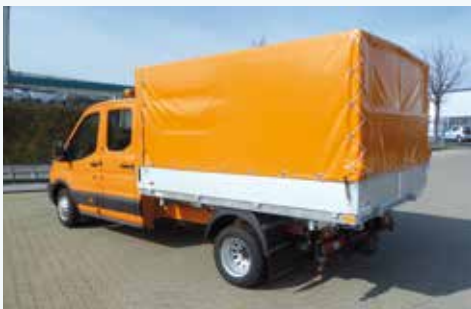
› Plane- und Spriegelaufbau