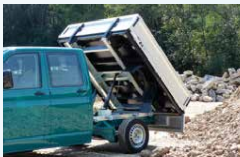
› Umbausatz Dreiseitenkipper