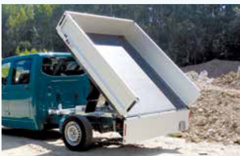
› Umbausatz Hinterkipper