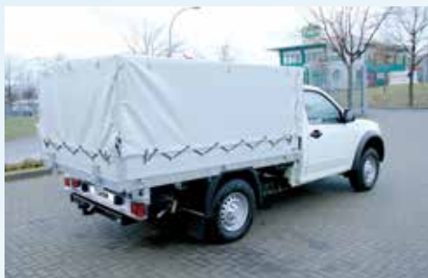
› Plane- und Spriegelaufbau